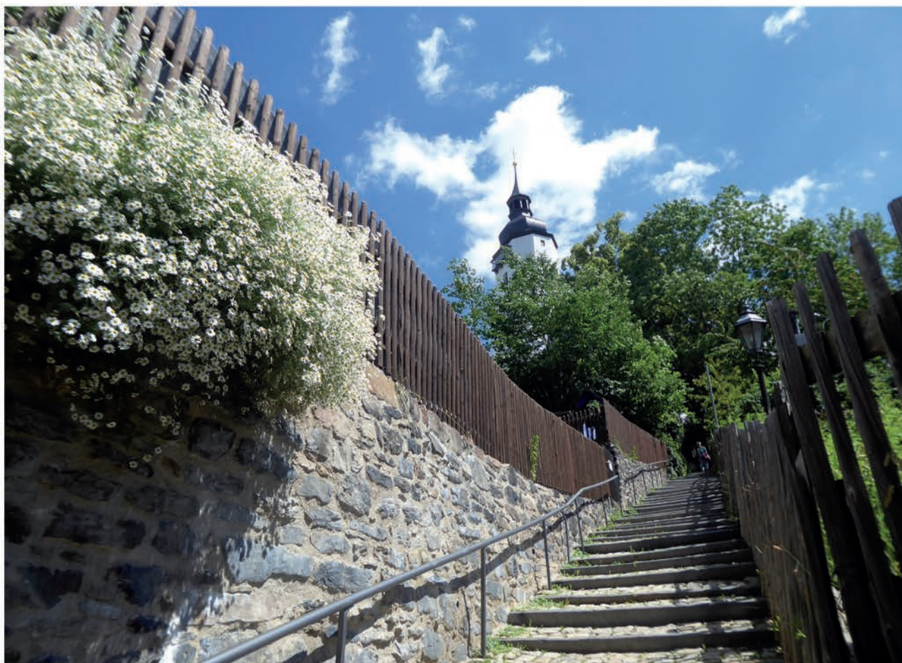
Abb. 1

N achdem die beiden Mitmachaktionen in Wangen bei den Klöppelnden, der Stadt Wangen und auch bei den Medien sehr gut angekommen sind, entstand die Idee, auch für Schwarzenberg eine Mitmachaktion ins Leben zu rufen. Dazu erstmal einige Hintergrundinformationen.